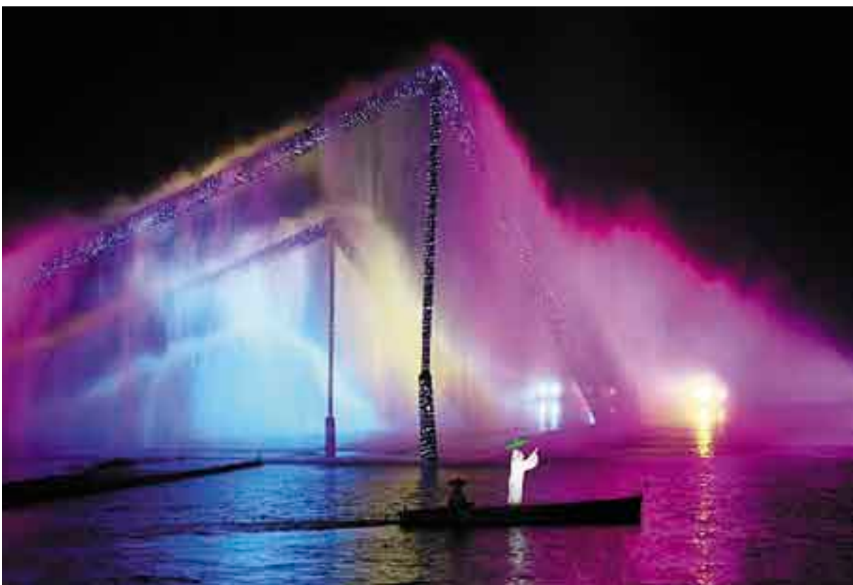
Plesna predstava na Zahodnem jezeru obuja staro legendo. (Cveta Potočnik)