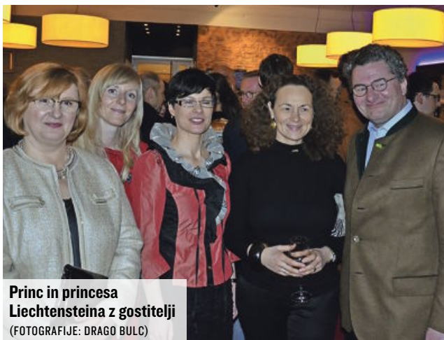
Princ in princesa Liechtensteina z gostitelji

novostih v slovenskem turizmu in pozitivnih pričakovanjih za leto 2014. Vodja predstavništva Spirit v Nemčiji je nemške novinarje obvestila o letošnjih promocijskih akcijah slovenskega turizma.