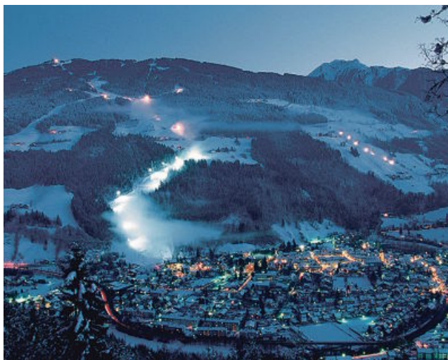
Zimsko nočno tihožitje Schladminga

T TURISTIČNA TRIBUNA Priloga Slovenskih novic urejanje Rok Šinkovc e-pošta rok.sinkovc@slovenskenovice.si likovna zasnovana Jožef Zver ekranski prelom Darja Malarič