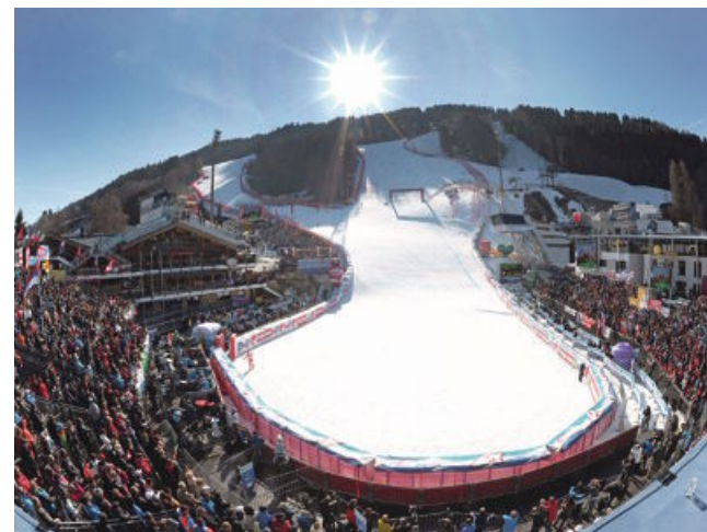
Ciljna arena, v kateri bodo znani prav vsi zmagovalci svetovnega prvenstva.

Planai, začetna postaja, od koder sledijo vzponi na vse strani.