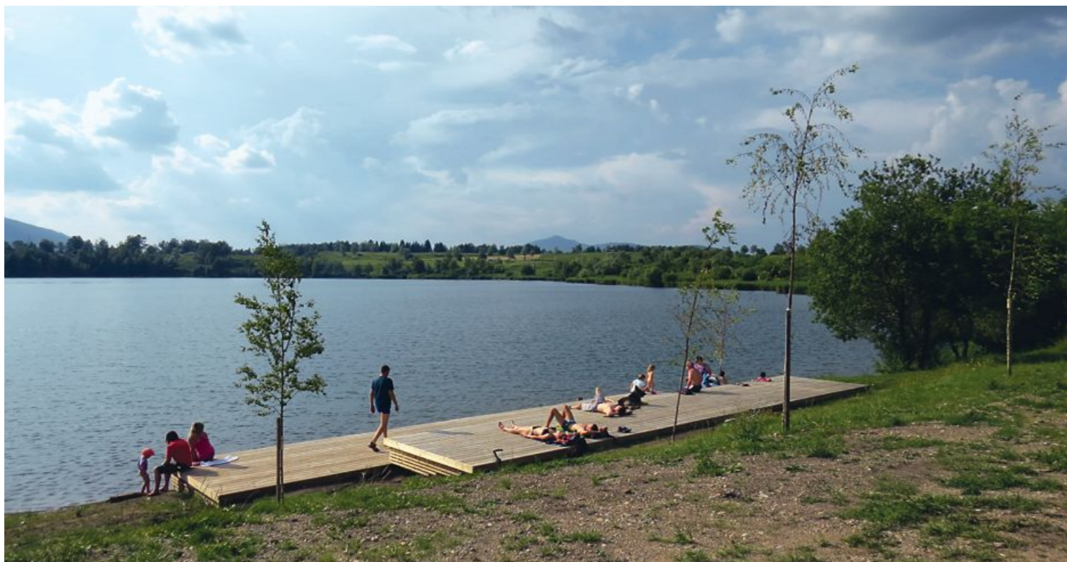
Kočevsko jezero