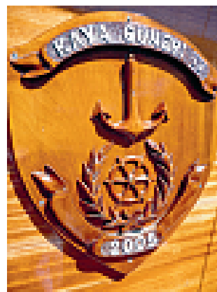
Detajla na guletu

spoznali v Bodrumu, se večje skupine (do 12 gostov) najpogosteje odločijo za različico s 6-člansko posadko. Cena za najem barke je okvirno 3000 evrov na teden, kar znaša prej omenjenih 500 evrov po osebi. Za takšen znesek vas bodo popeljali na križarjenje med bližnjimi otoki.