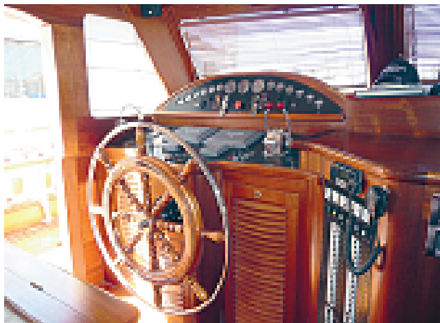
Mahagonijev les na komandni plošči s krmilom je tako zloščen, da na površinah ni opaziti niti enega prstnega odtisa