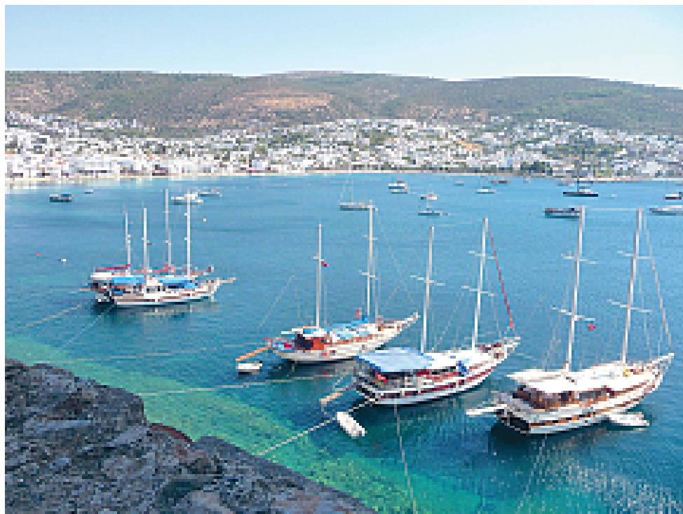
V zalivu v turškem Bodrumu se pozibavajo leseni guleti vseh velikosti in oblik

TURISTIČNA AGENCIJA GEA ŠEMPETER PRI GORICI tel.: 05/393 61 17, e-mail: gea.ta@iol.net 9.-10.4. - RIMINI - SAN MARINO - BOLOGNA 16.4. - VICENZA Z OKOLICO 26.4.-1.5. - ČUDOVITA SICILIJA 26.-27.4. - EUROFLORA IN CINQUE TERRE 3.5.-10.5. - TERME BANOVI 28.-29.5. - BAVARSKI GRADOVI 24.6.-26.6. - ŠVIČA Z VLAKOM BERNINA ODHODI IZ ŠEMPETRA IN NOVE GORICE