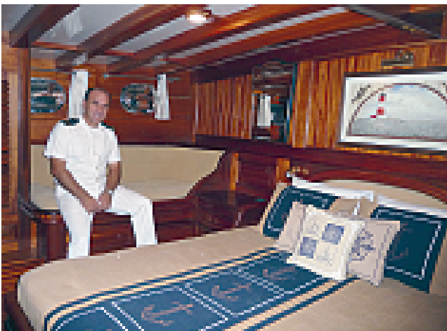
Kapitan Dogan v eni od luksuzno opremljenih kabin na guletu Kaya Guneri IV