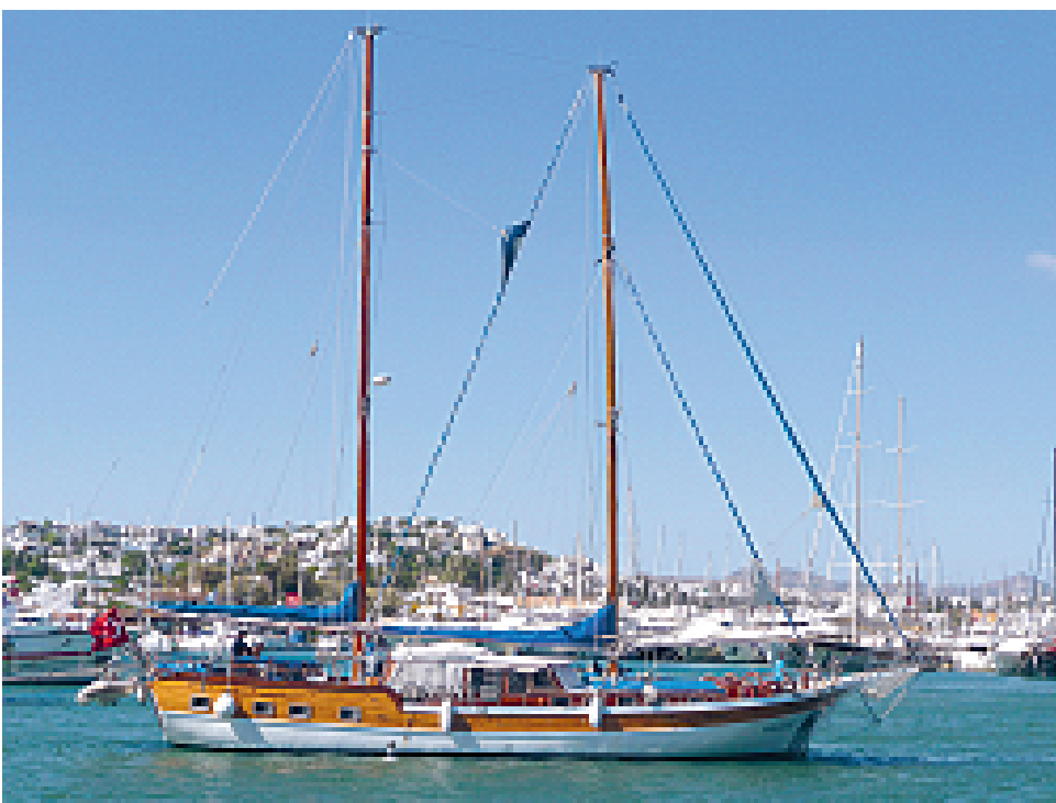
Danes je mogoče v turškem morju naštetih vsaj 2000 takšnih tradicionalnih lesenjač

Obisk marine v Bodrumu je tudi za nepoznavalce prava paša za oči. Tamkajšnja privezna mesta namreč zasedajo lično izdelane lesene barke, na katerih je takoj opaziti, da je bila izkušena človeška roka še kako pazljiva in natančna pri izdelavi vsakega najmanjšega