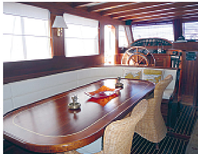
Mornarsko opremljen notranji salon

Obalno letovišče Bodrum v Turčiji je rojstno mesto lesenih bark guletov