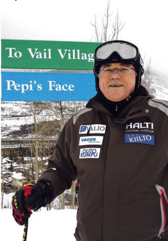
Vail je ameriški St. Moritz.