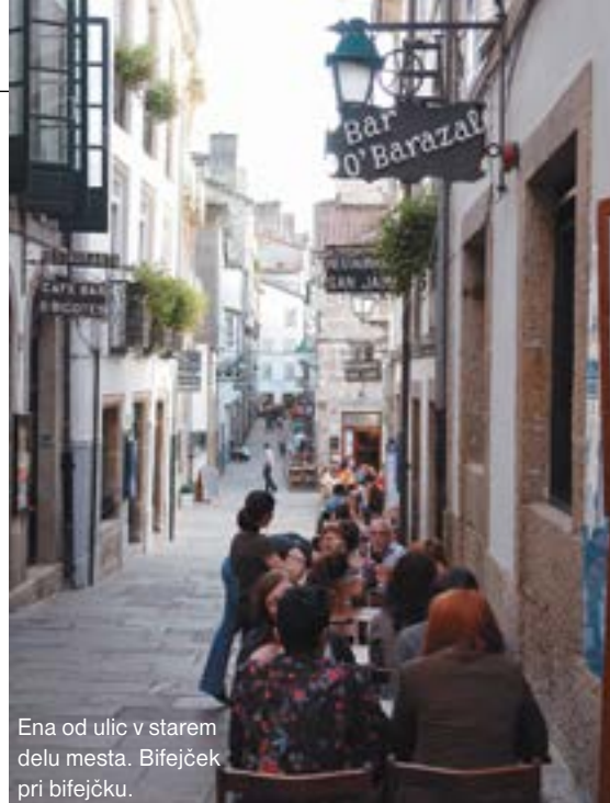
Ena od ulic v starem delu mesta. Bifeček pri bifečku.