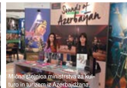
Mična stojnica ministrstva za kul-turo in turizem iz Azerbajdžana.

Tujih obiskovalcev je v Santiagu de Compostela vedno veliko, neredki pa v mesto prisopihajo s popotnimi palicam in nahrbtniki, ni jih malo, ki se v ta kraj napotijo celo iz Francije. Tamkaj se namreč začne znamenita Jakobova romarska pot, ki je dolga dobrih osemsto kilometrov! S kolesi pa tudi peš, z Bogom v dobrih mislih, s hrepenenjem po zdravju in z njim povezanim dolgim življenjem. Romarstvo je tam priljubljeno že več kot tisoč let, na leto se včasih odpravi na to pot skoraj 180 tisoč ljudi. Na vlaklu se, po znani nesreči, ker je strojevodja v ovinku, na katerem je omejitvev 80 kilometrov na uro, vozil s hitrostjo 190 kilometrov, ljudje precej manj družijo.