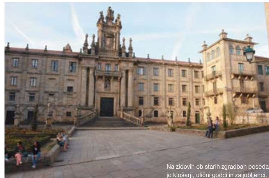
Na zidovih ob starih zgradbah poseda-jo klošarji, ulični godci in zaljubljeni.