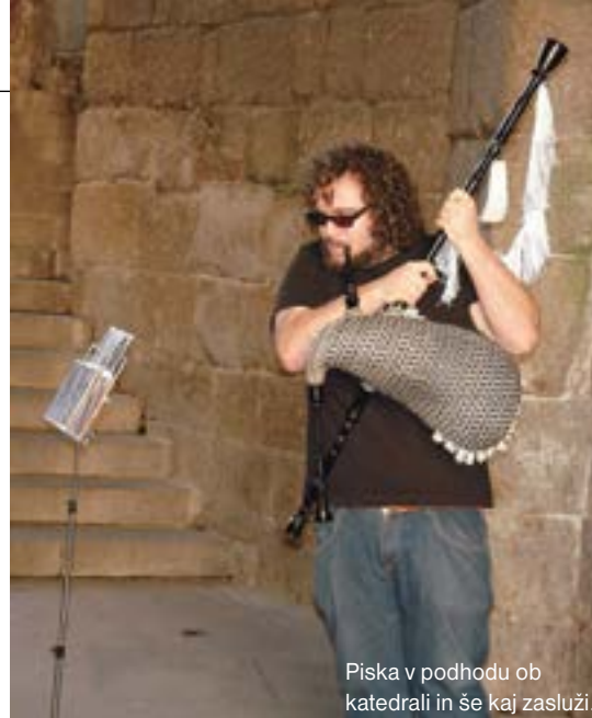
Piska v podhodu ob katedrali in še kaj zasluži.