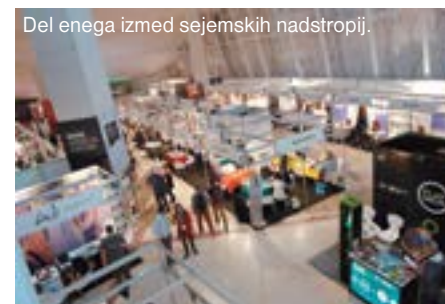
Del enega izmed sejmskih nadstropij.