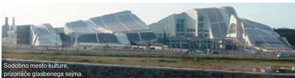
Sodobno mesto kulture, prizorišče glasbenega sejma.