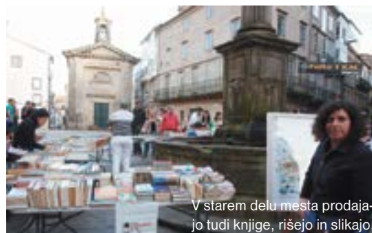
V starem delu mesta prodaja-jo tudi knjige, rišejo in slikajo.