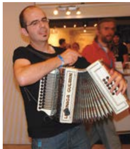
Harmonikar baskovske skupine Korrntzi.