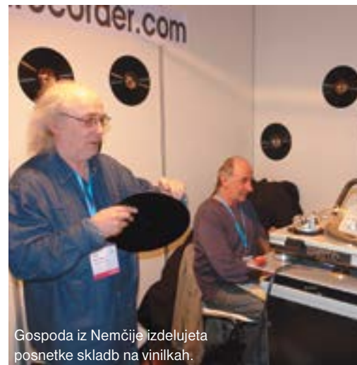
Gospoda iz Nemčije izdelujeta posnetke skladb na vinilkah.