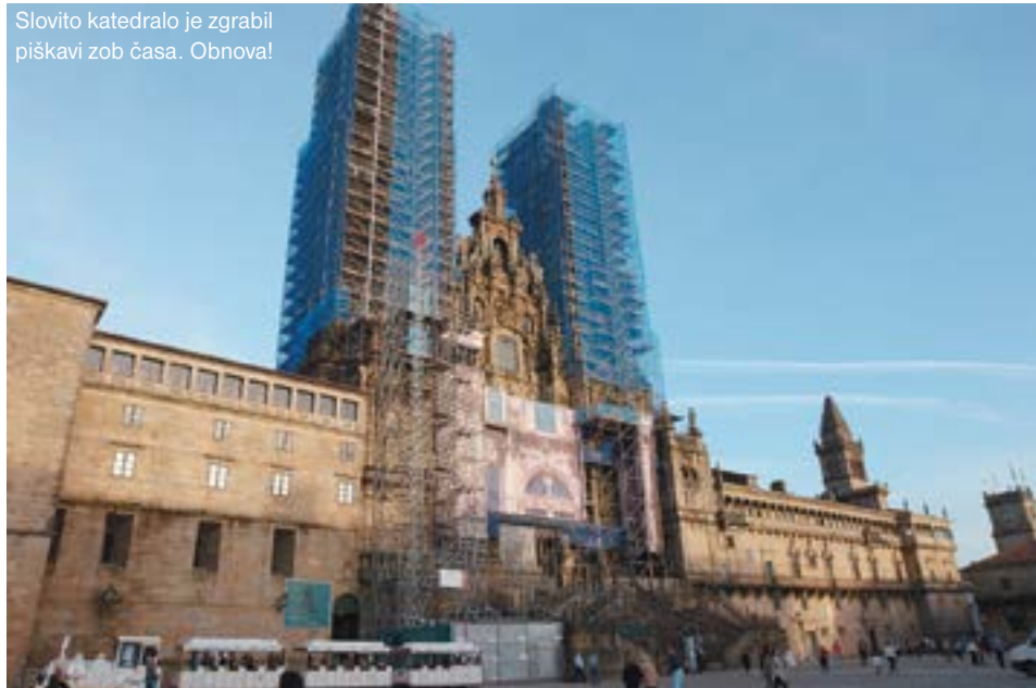
Slovito katedralo je zgrabil piškavi zob časa. Obnova!