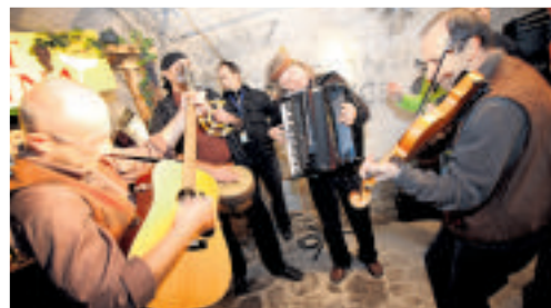
Za veselo razpoloženje in poklon prazniku vina bo poskrbela tudi domača glasba.