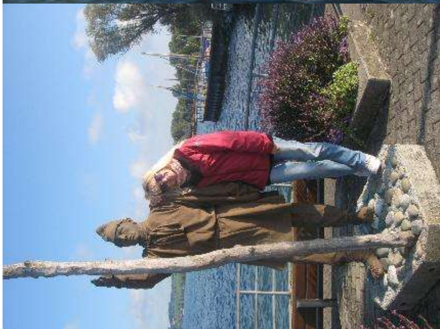
Gospod" Uhldi je veliko višji kot so bili koliščarji.