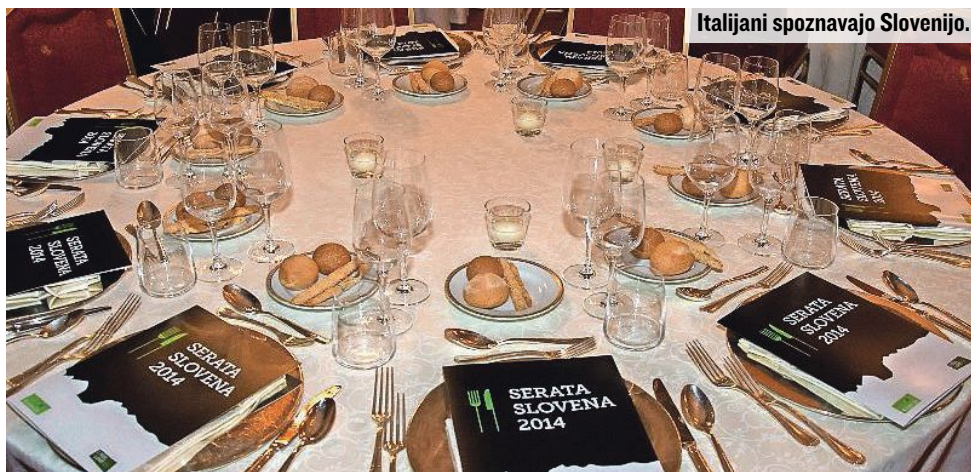
Italijani spoznavajo Slovenijo.