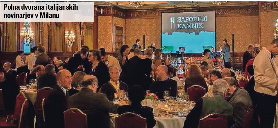
Polna dvorana italijanskih novinarjev v Milanu