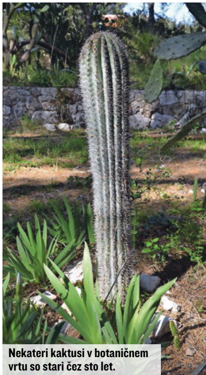
Nekateri kaktusi v botaničnem vrtu so stari čez sto let.

Veliko Slovencev se po dolgoletni tradiciji že za veliko noč odloči za počitnice na morju. Še posebno če ta pade skoraj v prvomajske praznike. Še več jih bo letos povezal dan upora proti okupatorju in veliko noč na eni strani ter prvi maj na drugi. S tremi dnevi dopusta ste tako prosti kar devet dni.