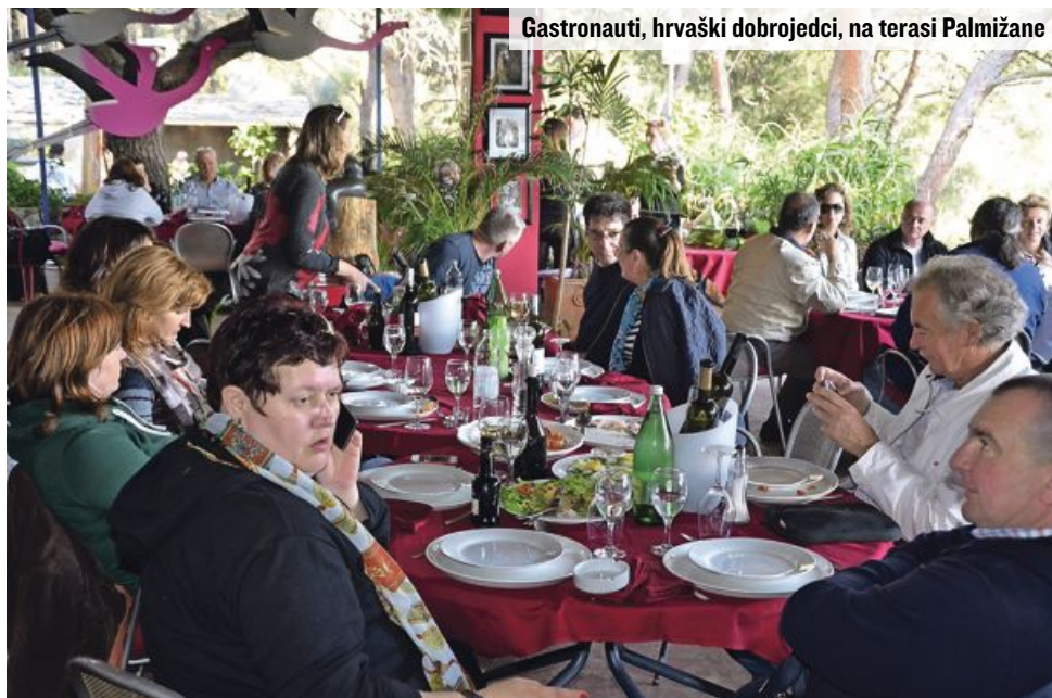
Gastronauti, hrvaški dobrojedci, na terasi Palmižane

Leta 1906 je botanik prof. Eugen Meneghello na otočku nedaleč od Hvara in daleč od civilizacije v svojem letnem dvorcu iz leta 1820 odprl penzion. To je bil začetek turizma na