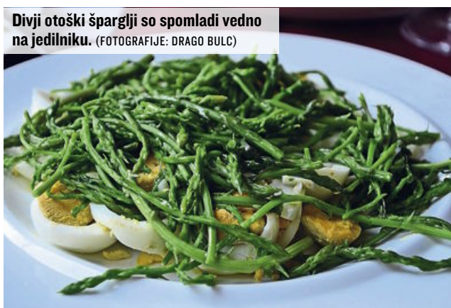
Divji otoški šparglji so spomladi vedno na jedilniku.

Toda pa je že toliko, da se lahko odpravite tudi na bolj oddaljene počitniške cilje. Za tiste, ki imajo plovila, so takšne počitnice, če je vreme seveda ugodno, tudi priložnost, da se odpravijo v srednjo in južno Dalmacijo. In prav za tiste, ki bodo izbrali počitnice na Hvaru, priporočamo obisk Peklenskih otokov (Pakleni otoci), predvsem otoček Palmižana, ki je v tem letnem času še posebno privlačen.