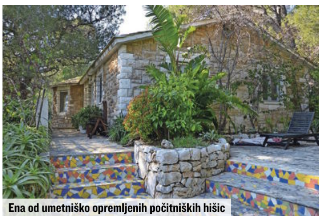
Ena od umetniško opremljenih počitniških hišic