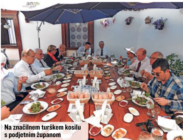
Na značilnem turškem kosilu s podjetnim županom