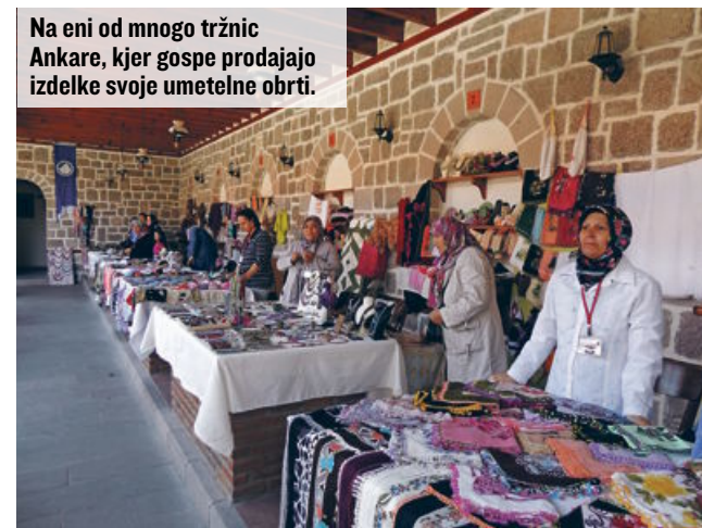
Na eni od mnogih tržnic Ankare, kjer gospe prodajajo izdelke svoje umetne obrti.