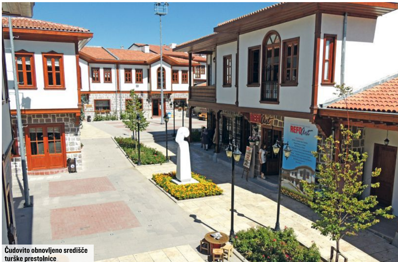
Čudovito obnovljeno središče turške prestolnice

T TURISTIČNA TRIBUNA Priloga Slovenskih novic urejanje Rok Šinkovc e-pošta rok.sinkovc@slovenskenovice.si likovna zasnova Jožef Zver ekranski prelom Darja Malarič