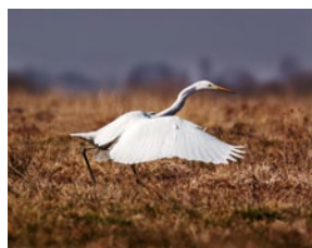
BESIDILO: VERA SIMONČIČ