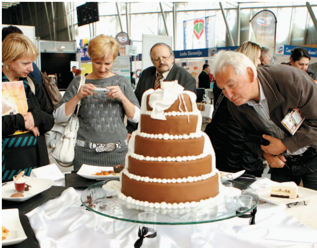
Na Gostinsko-turističnem zboru v okviru tretjih dnevov slovenskega turizma so se predstavili kuharji, slaščičarji in natakariji, v drugem delu pa so vodilni v panogi ugotavljali, kako izboljšati trženje z uporabo spleta. (Igor Napast)