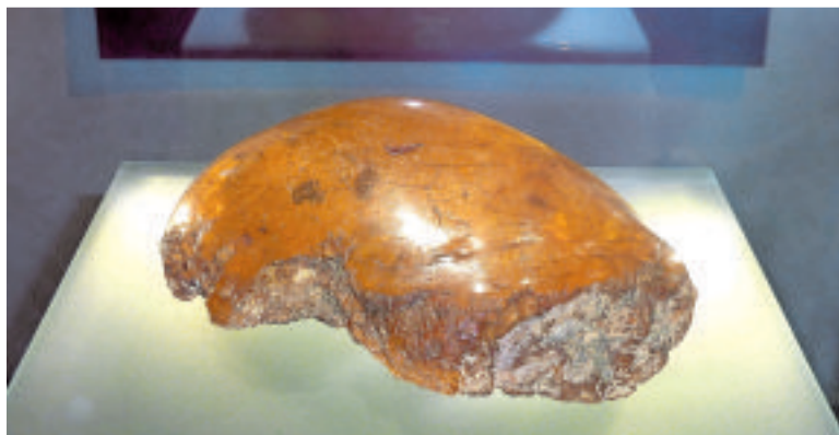
Največji surovec baltskega jantarja, razstavljen v Dolenjskem muzeju