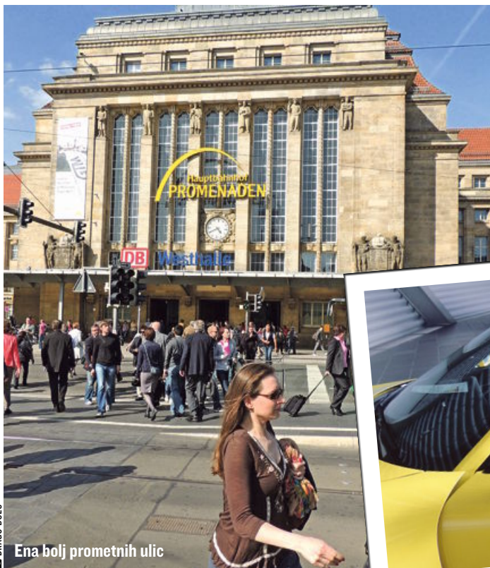
Ena bolj prometnih ulic

T TURISTIČNA TRIBUNA Priloga Slovenskih novic urejanje Barbara Pance e-pošta barbara.pance@slovenskenovice.si likovna zasnova Jožef Zver ekranski prelom Darja Malarič