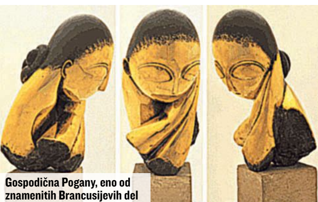
Gospodična Pogany, eno od znamenitih Brancusijevih del