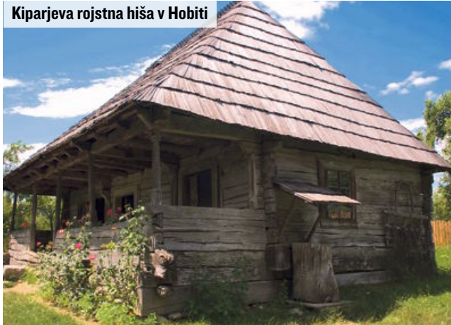
Kiparjeva rojstna hiša v Hobiti