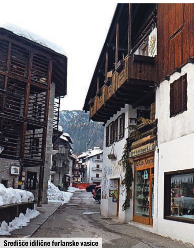
Središče idilične furlanske vasice