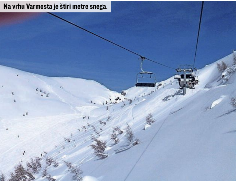
Na vrhu Varmosta je štiri metre snega.