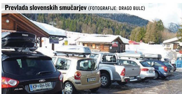
Prevlada slovenskih smučarjev