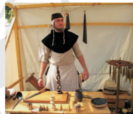
Prikaz svečarstva na folklornem festivalu.