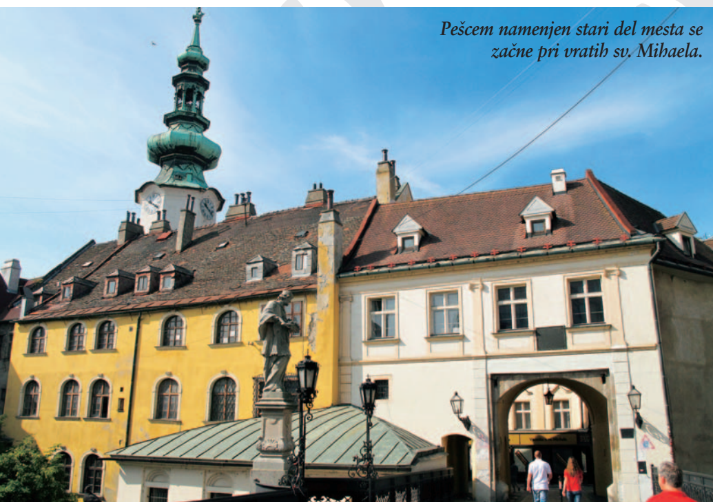
Pešcem namenjen stari del mesta se začne pri vratih sv. Mihaela.

Če se slovenske družine pogosteje odločajo za obisk avstrijske prestolnice, še posebej v predbožičnem času, pa jih precej manj obišče slovaško prestolnico Bratislavo. Pa ji s tem delajo veliko krivico, saj je le slabo urovožnje dlje od Dunaja, a ima Bratislava z okolico tudi veliko pokazati.