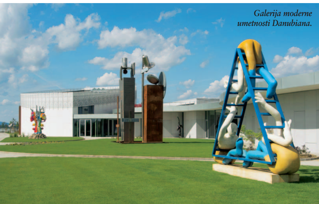
Galerija moderne umetnosti Danubiana.

Večina navigacij bo za pot do Bratislave predlagala avtocesto do dunajskega zunanjega obroča in nato po avtocesti v Bratislavo. Svetujemo pa, da se odločite za drugo pot mimo Wiener Neustadta skoraj do Nežiderskega jezera in po državni cesti čez državno mejo (ki je prava znotrajshengenska - torej je niti ne opazite) v bratislavsko predmestje Petržalka in nato v center Bratislave. Razlogi so vsaj trije: izognili se boste morebitni gneči pred Dunajem, z vožnjo po lepi cesti boste doživeli še nekaj tipične pokrajine avstrijske Gradišanske (Burgenland) in ker se boste izognili nekaj kilometrom slovaške avtoceste, vam ne bo potrebno kupiti slovaške vinjete. Za vožnjo po obvoznih in vpadnicah okrog Bratislave je ne potrebujete in če bo vaš cilj le Bratislava z okolico, deset evrov za vinjeto raje prihranite za kaj dobrega za pod zob.