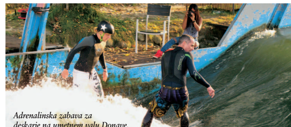
Adrenalinska zabava za deskarje na umetnem valu Donave.