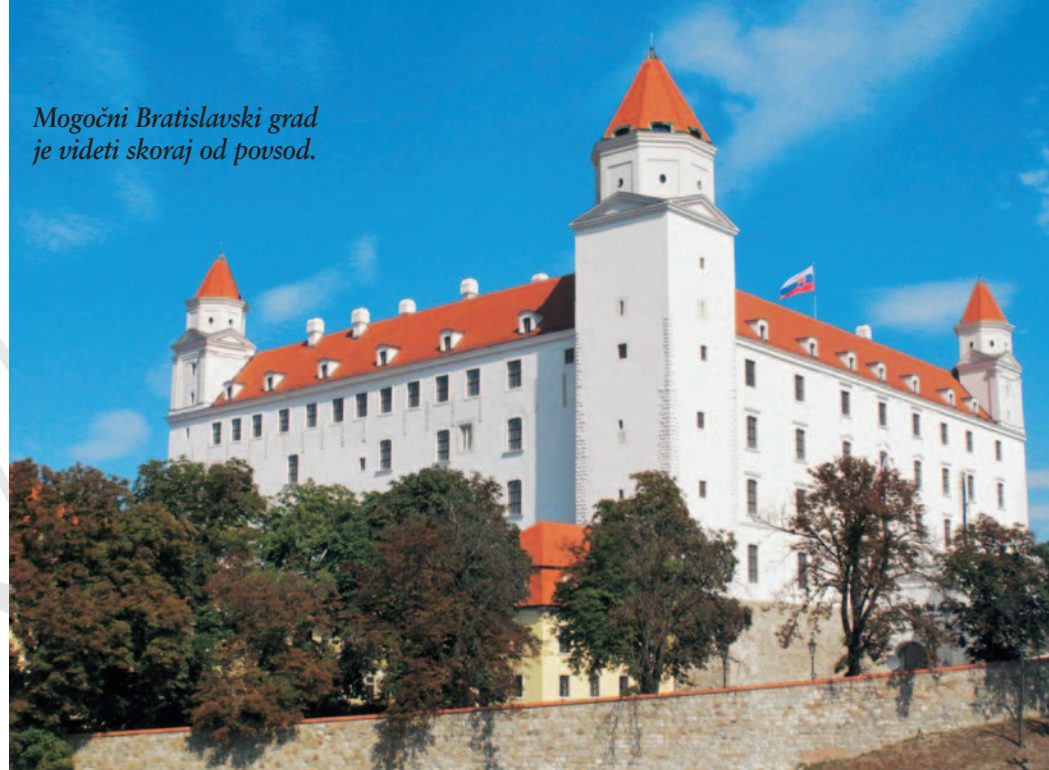
Mogočni Bratislavski grad je videti skoraj od povesod.