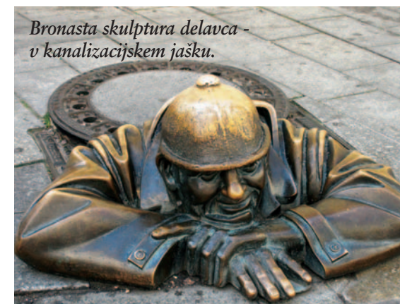
Bronasta skulptura delavca v kanalizacijskem jašku.