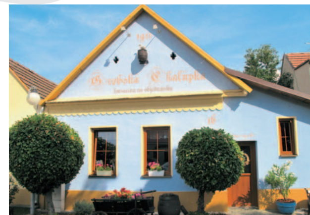
V slikovitem Slovenskem grobu imajo najboljše pečene goske.