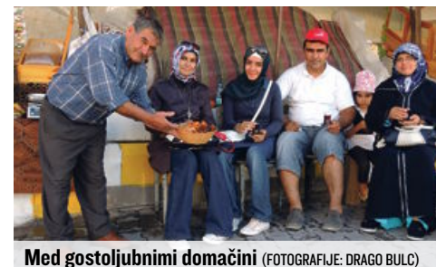
Med gostoljubnimi domačini