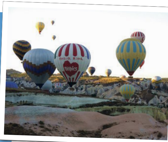
Eno od sedmih svetovnih čudes, Kapadokija, je očarljiva predvsem iz zraka.