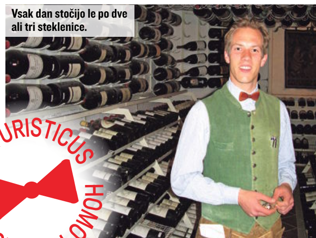
Vsak dan stočijo le po dve ali tri steklenice.