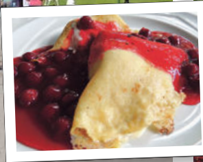
Slastne palićinke, pardon, palaćinke