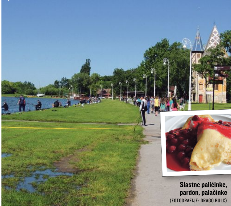
Živahno obrežje jezera v Paliću

T TURISTIČNA TRIBUNA Priloga Slovenskih novic urejanje Rok Šinkovc e-pošta rok.sinkovc@slovenskenovice.si likovna zasnova Jožef Zver ekranski prelom Darja Malarič