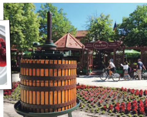
Hrana je odlična, vino prav tako.