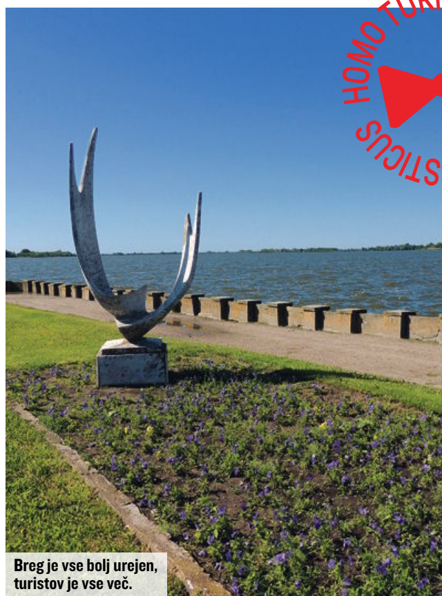
Breg je vse bolj urejen, turistov je vse več.