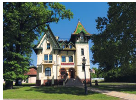
Vila Lujza, ena od obnovljenih lepotič Palića