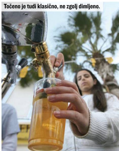
Točno je tudi klasično, ne zgolj dimljeno.