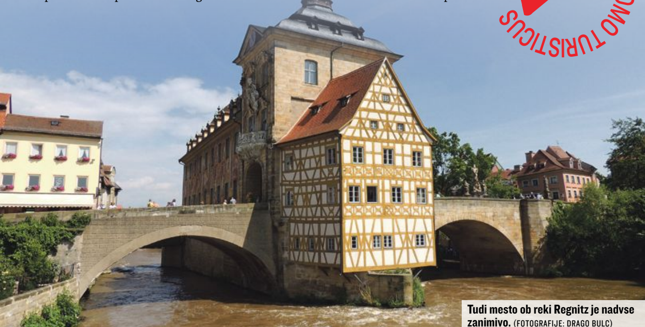
Tudi mesto ob reki Regnitz je nadvse zanimivo.