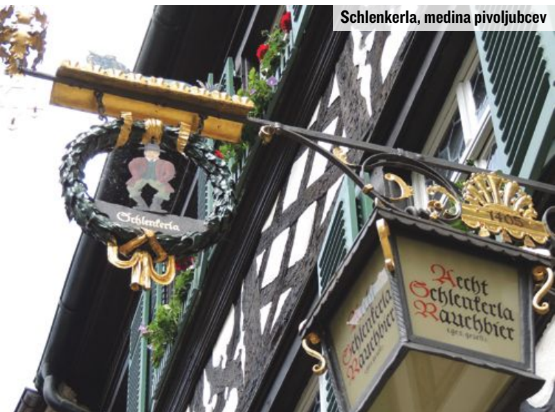
Schlenkerla, medina pivoljubcev