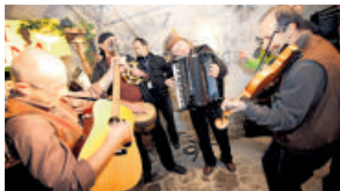
Za veselo razpoloženje in poklon prazniku vina bo poskrbela tudi domača glasba.