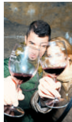
Podzemlje pod starim Kranjem je od leta 2008 obiskalo že več kot 22.000 gostov.

Z vstopnico bo vsak gost dobil kozarec in vrečko za kozarec, s katerima bo šel od vinarja do vinarja in brezplačno degustiral ponudbo vina. Pri nekaterih ponudnikih hrane bo mogoča tudi degustacija hrane.