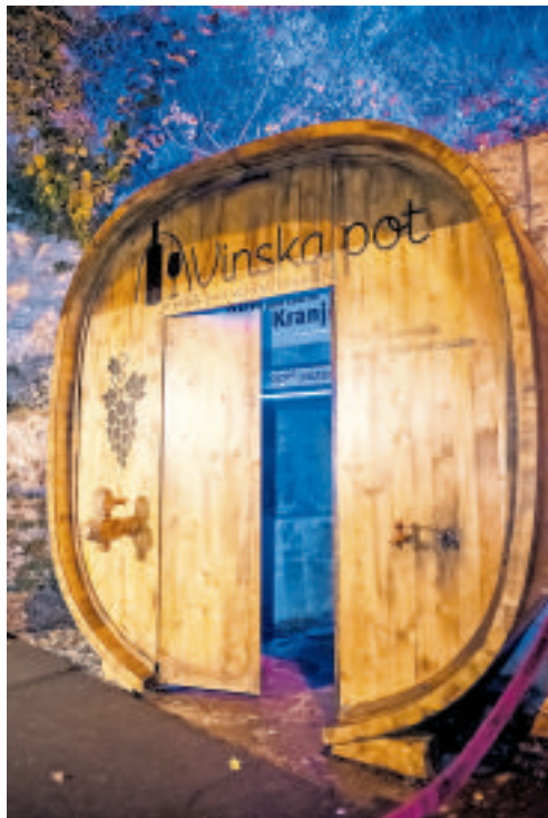
Ta konec tedna bodo kranjski rovi odprli vrata Vinske poti.

Organizator, Zavod za turizem in kulturo Kranj je letos k sodelovanju privabil kar 53 ponudnikov vina z vseh vinorodnih območij in kulinarike. Ker ima vsak sodelujoči ponudnik izjemno zgodbo, je po mnenju organizatorjev nepravilno izpostaviti katerega koli, so pa ponosni, da bodo del ponudbe tudi vinarji iz znane slovenske kleti Istenič. Ti bodo namreč prihodnje leto praznovali 50. obletnico delovanja in so bili v času nastanka prvo zasebno podjetje na Slovenskem, bili so tudi prvi, ki so začeli pridelavo penine po kla-