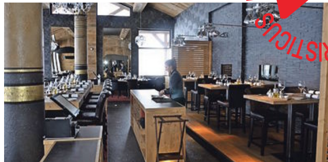
Restavracija z dvema Michelinovima zvezdicama visoko v hribih

apartmajev, 2 restavraciji, 2 bazena, bar in 800 kvadratnih metrov površine za wellness, lastno smučarsko trgovino s prestižno opremo za smučanje in deskanje ter celo lasten smučarski servis. Petičnim gostom, med katerimi je največ Angležev in Rusov, je na voljo tudi bižuterija. Se-