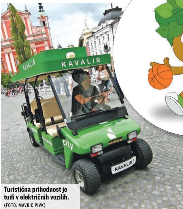
Turistična prihodnost je tudi v električnih vozilih.