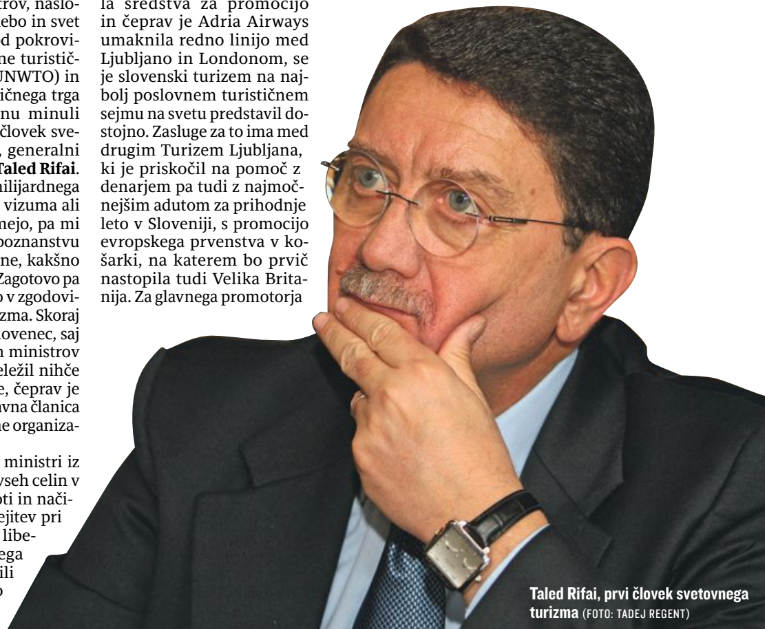
Taled Rifai, prvi človek svetovnega turizma