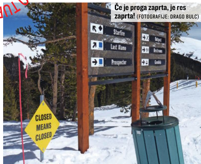
Če je proga zaprta, je res zaprta!

Avanture za najbolj nadobudne in romantične organizirajo tudi ponoči. Doživetja so po navadi povezana z večerjo in posebnim programom v gorski koči.