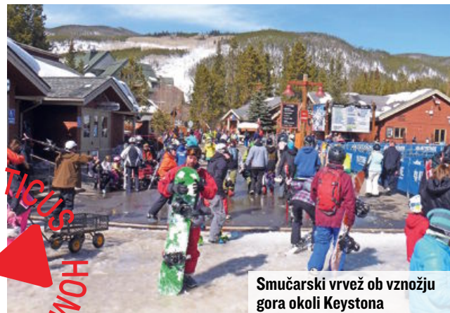
Smučarski vrvež ob vznožju gora okoli Keystonea

no, v Keystonu pa imajo za to teptalnik s posebno ogrevano prikolico, v kateri je prostora za 12 oseb. Za eno vožnjo je treba odšteti samo pet dolarjev, za daljše izlete pa seveda več.