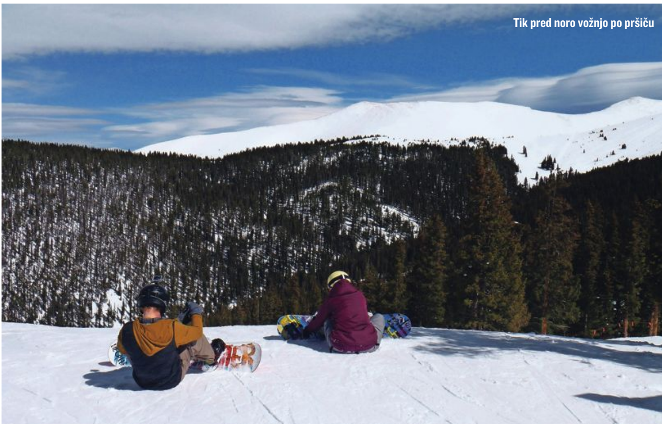
Tik pred noro vožnjo po pršiču