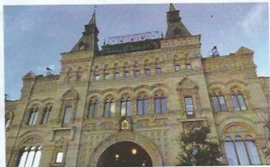
Razkošna blagovnica GUM na Rdečem trgu.