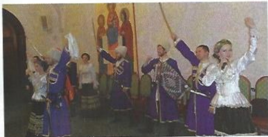
Šov kozakov, junakov preteklosti.