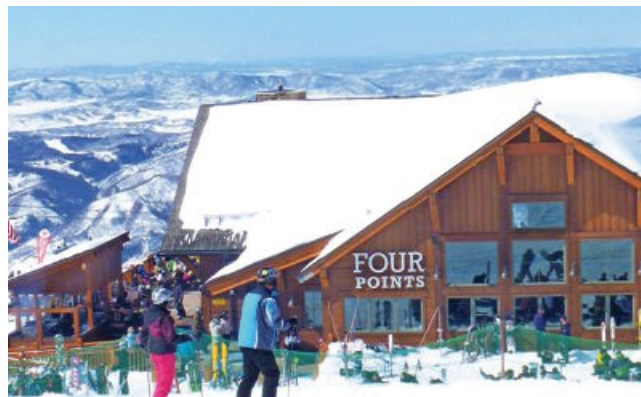
Najvišji vrh so poimenovali po tragično preminulem alpskem smučarju Wernerju.

Vozovnica je precej dražja kot kjer koli v Evropi.