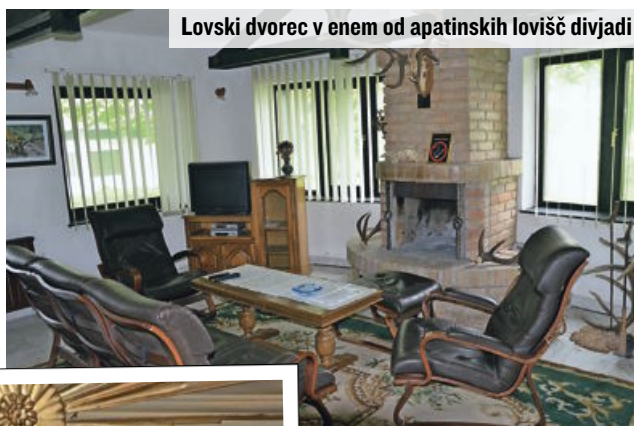
Lovski dvorec v enem od apatinskih lovišč divjadi