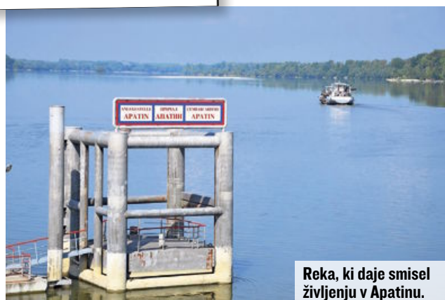
Reka, ki daje smisel življenju v Apatinu.