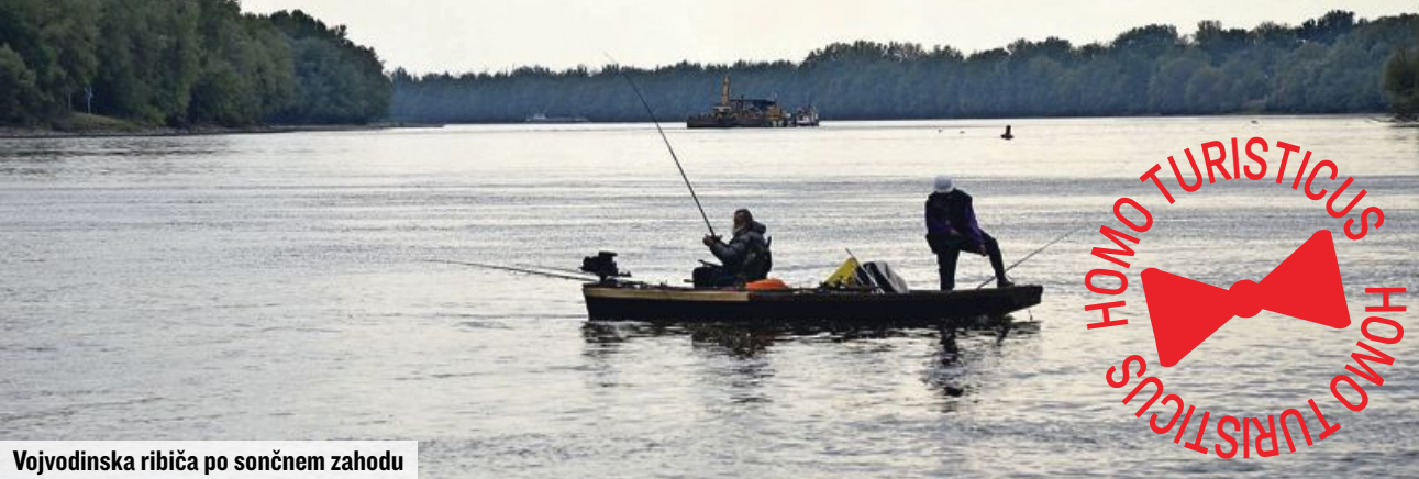
Vojvodinska ribiča po sončnem zahodu

Skoraj točno na sredini, točneje na 1408. kilometru najdaljše ulice v Evropi, kakor nekateri imenujejo najdaljšo evropsko reko Donavo, in nasproti hrvaškega Vukovarja leži starodavno vojvodinsko mestece Apatin. Ime je dobilo ob prihodu Slovanov, ki so opatijo poimenovali kar Apatin.