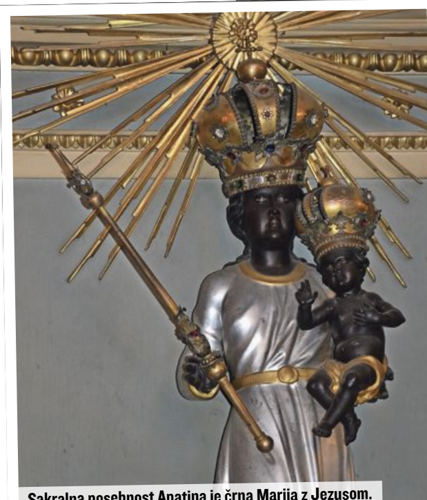
Sakralna posebnost Apatina je črna Marija z Jezusom.

vsem, kar je ob njej. Ker po reki po odstranitvi potopljenih mostov pri Novem Sadu in Beogradu poleg tovornih ladij pluje vse več potniških, so v Apatinu zgradili pristanišče za največje turistične ladje. Želijo jih namreč vsaj za en dan zadržati v mestu in okolici.