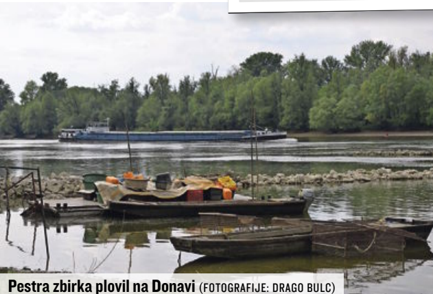
Pestra zbirka plovil na Donavi