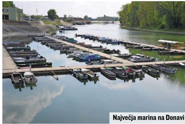
Največja marina na Donavi

Turistično prihodnost v Apatinu torej vidijo v Donavi in